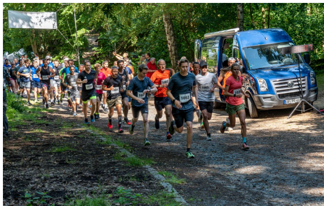
10km-Lauf: Start und ....