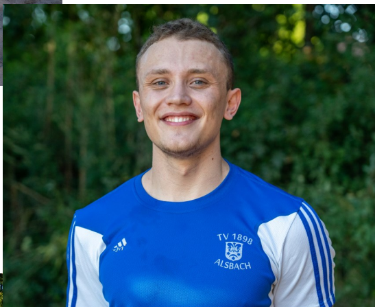
Abteilungsleiter und Trainer