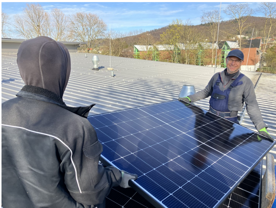
Solaranlage: Montage auf dem Dach der Hinkelsteinhalle