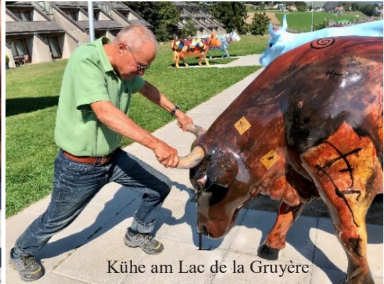
Kühe am Lac de la Gruyère

Gegen 18 Uhr erreichten wir unser Hotel Kristall-Saphir in Saas-Almagell.