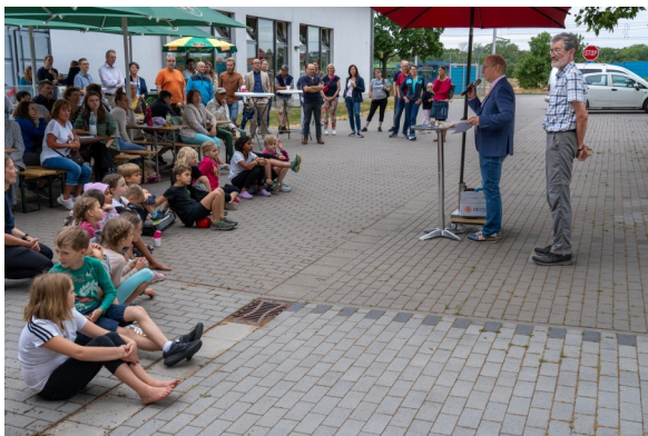
Reden und Zuhörer