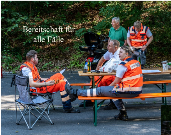
Bereitschaft für alle Fälle