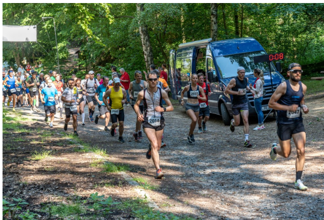
20km-Lauf: Start und ....