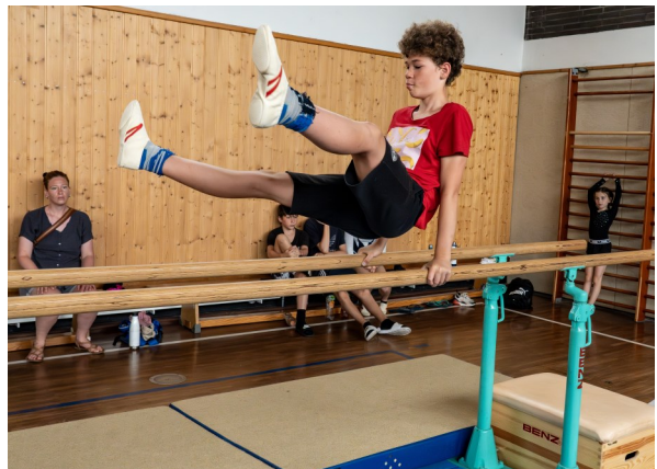
Eindrücke von den Vereinsmeisterschaften