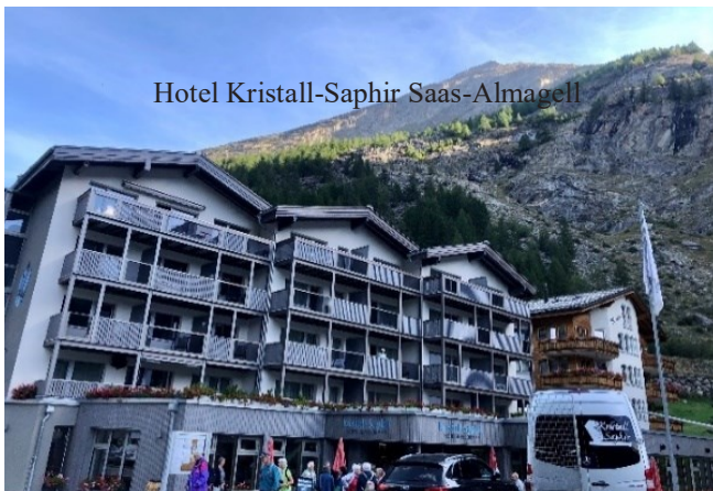
Hotel Kristall-Saphir Saas-Almagell